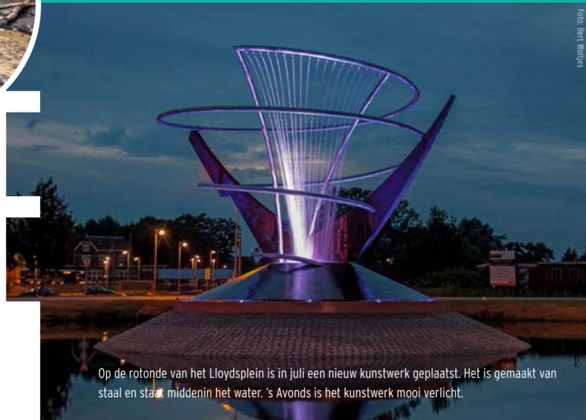
Op de rotonde van het Lloydsplein is in juli een nieuw kunstwerk geplaatst. Het is gemaakt van staal en staaf, middenin het water. 's Avonds is het kunstwerk mooi verlicht.

Fietsverkeer "Naast het autoverkeer denken we ook aan de veiligheid van het fietsverkeer, omdat veel fietsers gebruiken van de verschillende fietsroutes in en rondom Veendam", vervolgt Jager. "We gaan daarom het fietspad